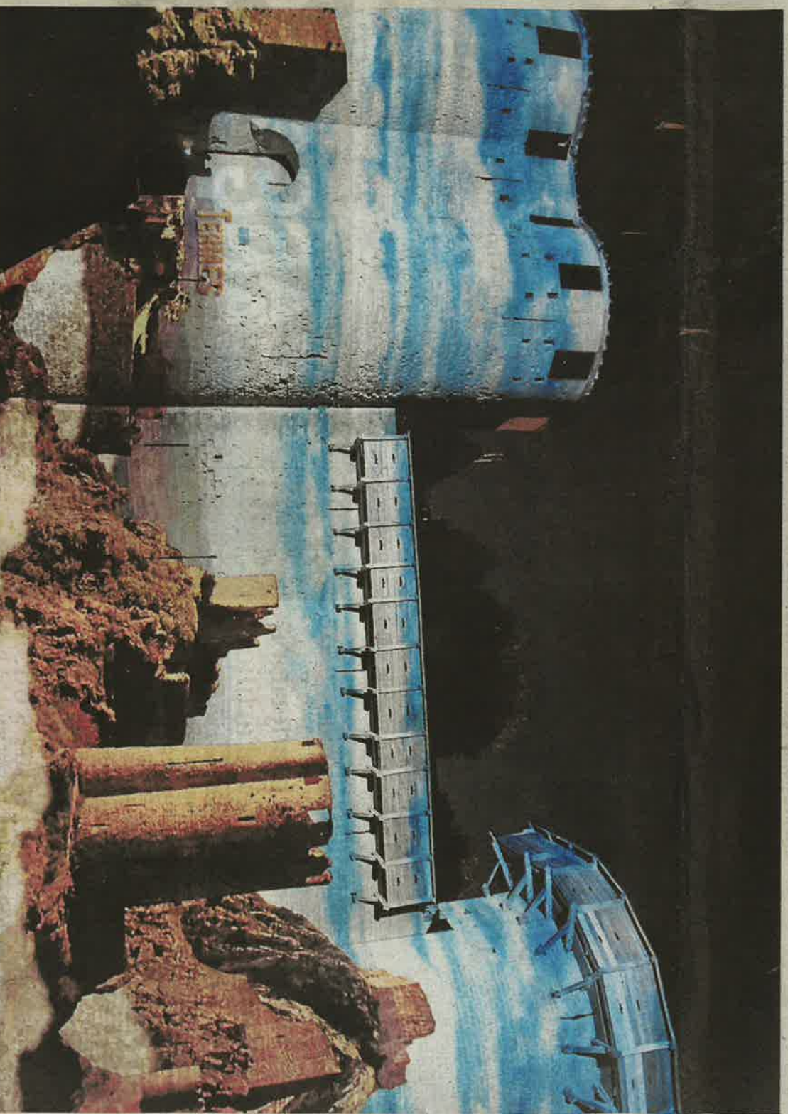
Chaque soir, les trois représentations font le plein. Le spectacle imaginé par Amancio Productions séduit visiblement les touristes. Le mur de la barbacane du château sert de support pour les projections vidéos.