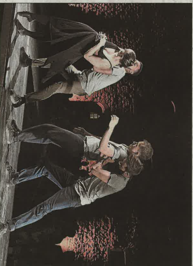
Les danseurs de la compagnie Spoart ont enchanté le public de la Cité des pierres vivantes.

Pour rappel, le divertissement, structuré autour de trois disciplines artistiques distinctes (projection illustrée, jeu de viole de gambe et danse) a été commandé par le Centre des Monuments nationaux à la demande de la mairie, dans le but de renforcer l'attractivité touristique de la Cité pour le mois d'août. Part tenu ! Le spectacle a remporté un franc succès, au regard des chiffres communiqués par Amatio Production .